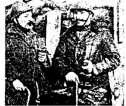
Le musée du tabac à Wervik (B)

Très concerné par la guerre 14-18, Comines-Warneton offre bien des possibilités de visite 14-18 (4,5 km): > Mémorial britannique: un temple circulaire impressionnant, gardé par deux lions de pierre. Les noms de 11.447 soldats britanniques sans sépulture y sont gravés (à Ploegsteert). > Croix de la trêve de Noël: souvenir de la fraternisation entre soldats britanniques et allemands l'hiver 1914 (Warneton). > Plaque Bruce Bairnsfather: hommage au soldat qui caricaturait la guerre (Warneton). > Stèle Maori: un monument dédié à la mémoire de Charles Sciascia, soldat néo-zélandais, l'origine maori (Warneton). > Centre de Documentation: spécialisé dans la sauvegarde du patrimoine, il abrite des milliers d'ouvrages et deux musées. > Blockhaus pionnier: transfor-