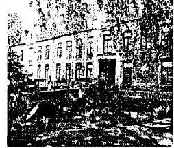
Le château de Roversart