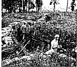
Les tranchées du Bayernwald

4 Ossuaire français et tranchées allemandes