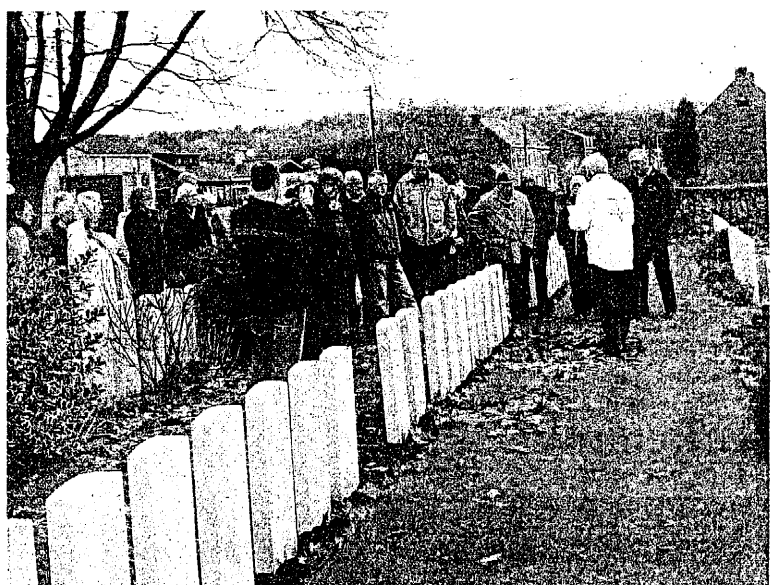
Ce vendredi, un car de touristes anglais visitait un des cimetières militaires de Ploegsteert

La carte représente, côté recto, tout le territoire de "Deulys" sur lequel figurent un parcours voiture et cycliste, cinq sites à visiter par commune, la Lys et la Deûle et la ligne de front anglo-allemand (en hachuré sombre). Côté verso, l'on trouve sept plans bien détaillés reprenant chaque fois les cinq sites 14-18 à découvrir en parcourant un circuit pédestre de 4 à 8 km avec une brève description de tous ces sites et des photos. Les légendes y sont très claires. Une carte trilingue remarquable qui constitue là un bel outil de qualité et une invitation évidente à s'élanter, à pied, ou à vélo (ou encore en voiture), sur les chemins de la Grande Guerre, qui réserveront aux visiteurs d'un jour plein de surprises et d'émotions.