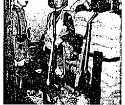
Le thème 14-18 omniprésent