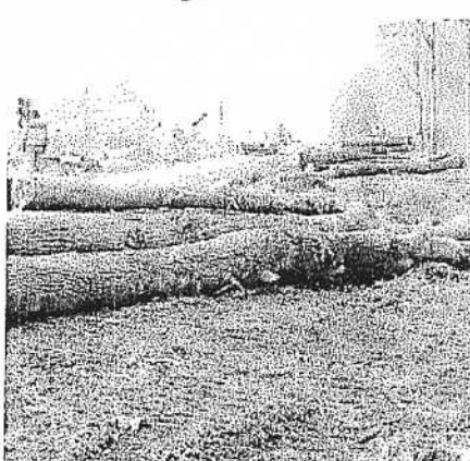
Pour la piste cyclable, toute une série d'arbres ont été abattus.