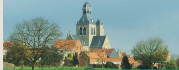
Saint-Nicolas church with crypt and carillon / Eglise Saint-Nicolas avec crypte et carillon Sint-Nicolas kerk met crypte en Bejaard / Sankt-Nikolaus-Kirche mit Krypta und Glockenspiel

In der Kirche mit ihrer weithin bekannten Kuppel befindet sich die denkmalgeschützte Krypta der Gräfin Adele von Frankreich. Während des zweiten Weltkriegs diente diese Krypta als deutsches Lazarett.