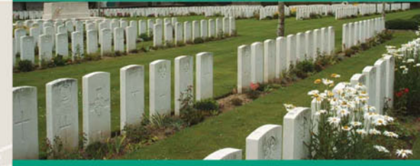
Messines Ridge British Cemetery

Auf diesem Friedhof haben 1503 Soldaten unterschiedlicher Nationalitäten ihre letzte Ruhe gefunden. Nur 549 Körper konnten identifiziert werden.