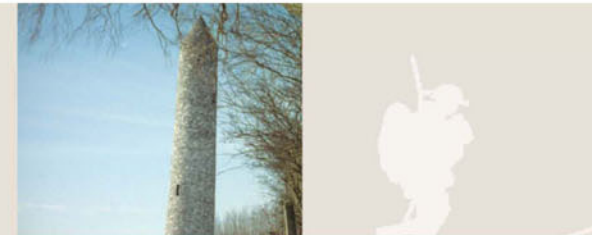
Ireland Peace Park / Le parc de la paix de l'île d'Irlande Iers vredespark / Friedenspark der Insel Irland

Dieser Park wurde von jungen Menschen aus Nordirland und der Republik Irland gegründet und steht für Frieden und Versöhnung. Er ist eine Ehrenweisung für alle von der irischen Insel stammenden gefallenen Soldaten.