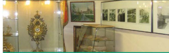
Historical Museum / Musée historique Historisch Museum / Geschichtsmuseum

Dieses Museum besitzt eine reiche Sammlung mit Waffen, Uniformen, Kunstgegenständen, Fotografien und einzigartigen Dokumenten aus dem Ersten Weltkrieg.