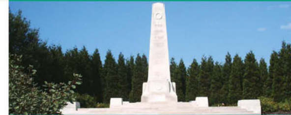
New Zealand Monument / Monument des néo-Zélandais Nieuw-Zeelands monument / Neuseeländisches Monument

Dieser Obelisk aus weißem Stein wurde zum Gedenken an den neuseeländischen Sieg in der Schlacht von Messines Ridge (7/6/1917) errichtet.