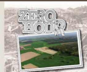
Zero hour ( www.zerohour.be )

Diese Ausstellung mit Filmvorführung Besucherzentrum in De Bergen zeigt die Geschichte der britischen Tunnelbauer und der deutschen Sprengkommandos anhand von seltenem Film- und Fotomaterial und gibt eine Übersicht der Gefechte zwischen dem 7. und dem 14. Juni. Sie zeigen auch die Auswirkungen der Bombardierungen auf die Landschaft.