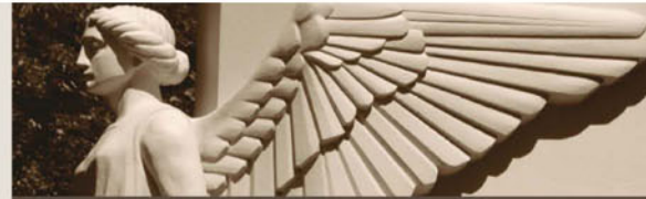
French mass grave on Mount Kemmel / Ossuaire français sur le Mont Kemmel Frans massagraf Kemmelberg / Massen grab am Kemmel-Berg

Französisches Massensepulkre mit 5294 unbekanntem Soldaten, die während des Kampfes für den Kemmelberg getötet geworden sind.