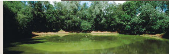
Pool of Peace / Spanbroekmolen

Dieser Krater ist eine Narbe in der Landschaft nach der Bombardierung vom 7. Juni 1917. Heute ist der "Friedenspool" ein stiller Ort der Besinnung.