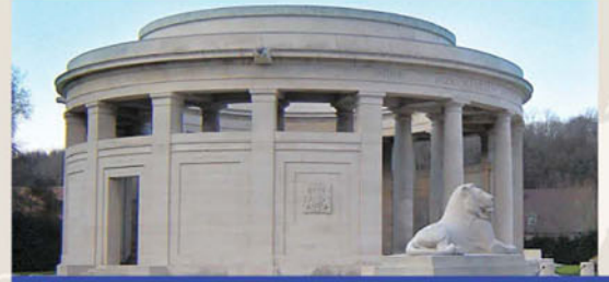
British Memorial / Mémorial britannique Brits memoriaal / Britisches Memorial

Kreisförmiger, beeindruckender, von 2 Steinlöwen bewachter Tempel. Hier sind die Namen von 11447 britischen Soldaten und Offizieren, die anonym bestattet wurden, eingraviert.