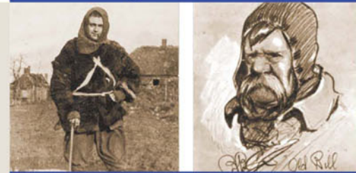
Lieutenant Bruce Bairnsfather / Lieutenant Bruce Bairnsfather Luitenant Bruce Bairnsfather / Lieutenant Bruce Bairnsfather