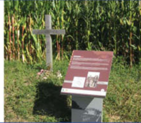
Christmas Truce Cross / Croix de la trêve de Noël / Gedenkruis van de Kerstmisverzoening / Kreuz der weihnachtlichen Waffenruhe

Zur Erinnerung an die Verbrüderung zwischen britischen und deutschen Soldaten: Austausch von Zigaretten, persönlichen Gegenständen und Fußballspiel, ... in der Nähe des Waldes von Gheer.