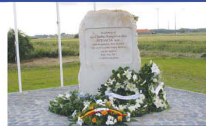
Monument in the honour of the soldier maori Stèle en l'honneur du soldat maori Gedenkteken ter ere van de Maorisoldaat Monument in der Ehre des Soldaten maori

Monument in der Ehre des Soldaten maori, Charles Sciasca an Basseville (Warneton): aufgerichtet am Pont-Rouge in Gedächtnis dieses neuseeländischen Soldaten, der ohne Grab gestorben ist.