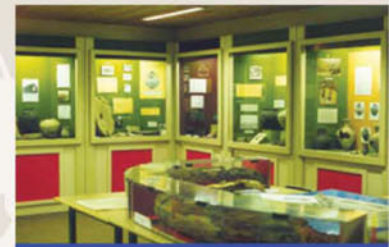
Documentation Centre / Centre de Documentation Centrum voor Documentatie / Zentrum für Dokumentation

Dieses Zentrum hat sich in der Erhaltung und Konservierung des örtlichen Kulturerbes spezialisiert und bietet eine Besichtigung der angeschlossenen Museen, aber auch eine große Sammlung an Dokumenten und einen berühmten Fundus für die Ahnenforschung, an. Es veröffentlicht jährlich ein Band der "Mémoires" (Erinnerungen).