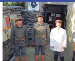
German museum bunker / Blockhaus pionnier Duitse museumbunker / Blockhütten-Pioniermuseum

Umgebaut in ein Museum. Es zeigt das Leben der deutschen Pionier-Soldaten von 1914 bis 1918. Es liegt in Comines, in der Nähe des Schleifenmuseums.